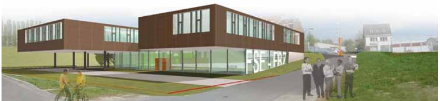
De maquette van het Marly gebouw in Brussel

KVZ verzorgt vanaf dit jaar, in onderaanneming, alle onderhoudswerken qua verlichting op de rijks- en autosnelwegen in Oost- en West-Vlaanderen. Dat gaat van het vervangen van lampen over het vervangen en herstellen van palen na een aanrijding tot het onderhoud van de cabines. Dit is een project met een aanzienlijke omzet. Maar het vraagt ook een nieuw engagement. We moeten de trend volgen om een permanente dienst te verzekeren, om altijd paraat te staan en 24 uur op 24 uur service te kunnen garanderen.